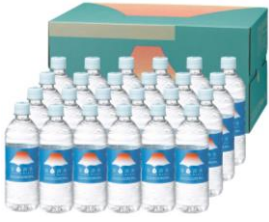
富士清水バナジウム & シリカ天然水 ミツウロコビバレッジ