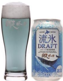
流氷ドラフト 網走ビール