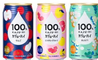
100%カジュハイ 富永貿易