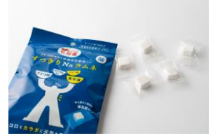
パクパクぱっくん乳酸菌シリーズ すっきりNaラムネ SiCi