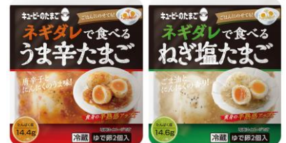
キューピーのたまご ネギダレで食べるシリーズ キューピー