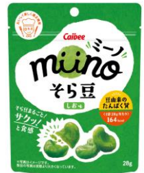
miino そら豆しお味 カルビー