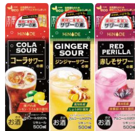
HiNODE コーラサワーの素 キング醸造