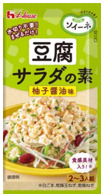
ソイーネ 豆腐サラダの素 柚子醤油味 ハウス食品