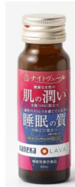
ナイトヴェール カネカ