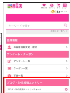
スマートフォン版