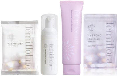
フェミフローラシリーズ わかもと製薬