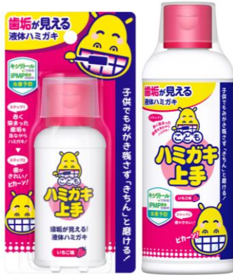
こどもハミガキ上手 丹平製薬