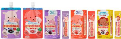
おくすり飲めたね 龍角散