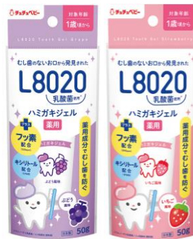
ChuChu L8020乳酸菌 薬用ハミガキジェル いちご風味・ぶどう風味 ジェクス